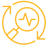
Ispezione, calibrazione, pulizia e aggiornamento annuali dello strumento