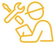
Danni accidentali e riparazione

La garanzia Gold offre una copertura di gran lunga superiore rispetto alla nuova garanzia prodotti per assicurarti di sfruttare al massimo il tuo investimento.