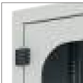
Cerniera con apertura a 180°