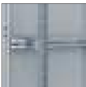
Montanti numerati e regolabili