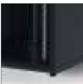
Montanti numerati e regolabili