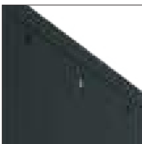
Pannelli laterali 2 sezioni