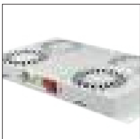
Gruppo di ventilazione