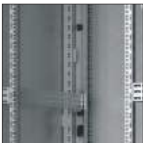
Quattro montanti numerati e regolabili