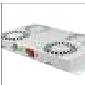
Gruppo di ventilazione