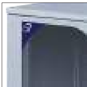
Fornibile su richiesta con porta grigliata