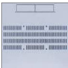
Predisposizioni di aerazione