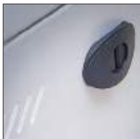
Pannelli laterali amovibili e con aerazione