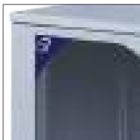
Fornibile su richiesta con porta grigliata