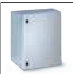
Versione porta cieca