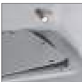
Flangia ingresso cavi asportabile