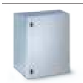
Versione porta cieca