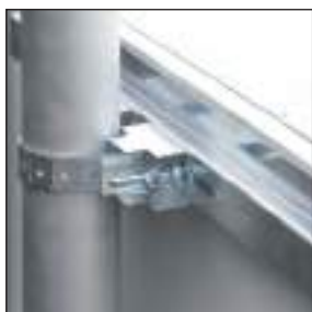
Disponibile con supporto per installazione a palo