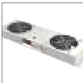
Gruppo di ventilazione