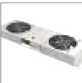
Gruppo di ventilazione