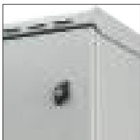
Doppia chiusura con chiave