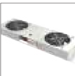
Gruppo di ventilazione