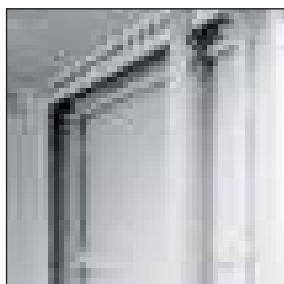
4 montanti regolabili [solo per versione assemblata]