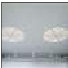
Predisposizione per ventole singole