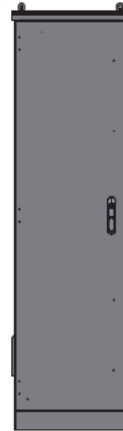
Vista dal retro