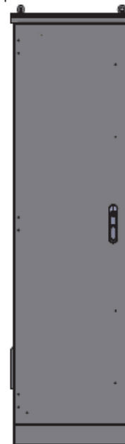
Vista dal retro