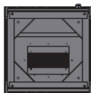
Vista dal fondo