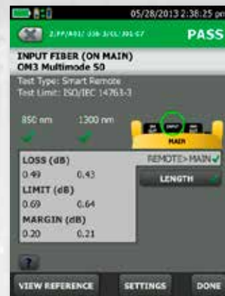
Il dettaglio mostra il margine e i limiti consentiti per la fibra su due lunghezze d'onda.